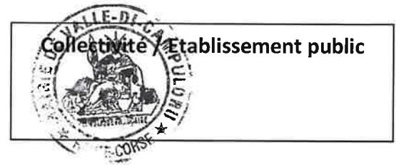
TABLEAU D'AVANCEMENT AU GRADE DE ADJOINT tech pal 1 er cl. CATEGORIE 6 ANNEE 2023

Vu le code général des collectivités territoriales, Vu le Code général de la fonction publique, notamment ses articles L522-23 à L522-31, Vu l'arrêté portant adoption des lignes directrices de gestion après avis du Comité Technique.